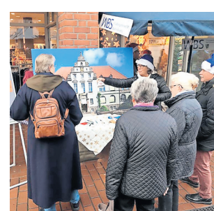
Die WBS befragte Passanten nach ihren Wünschen fürs Amtsgericht.

chen mit den WBS-Vertretern kristallisierten sich drei Wünsche der Bürgerinnen und Bürger besonders heraus. An erster Stelle wurde von ganz vielen der Wunsch geäußert, das Standesamt