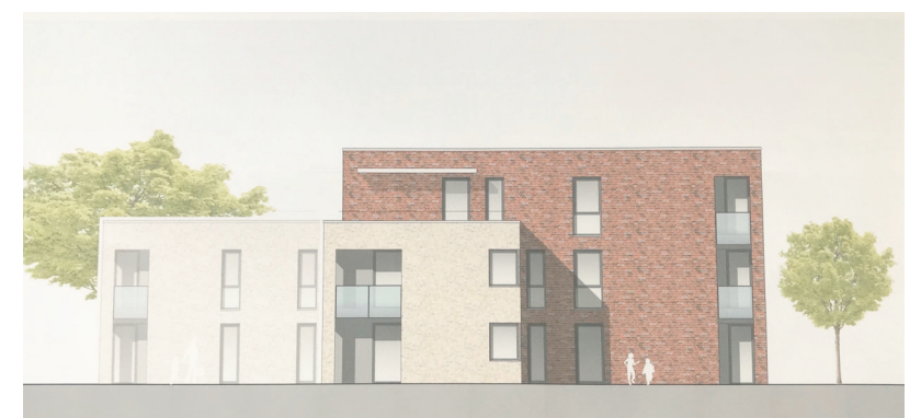
Ansicht von einem der beiden Geschossbauten. Das zweite Gebäude sieht genauso aus – nur spiegelverkehrt. ZEICHNUNG: ARCHITEKT NORBERT HOCHGÜRTEL

Rund 5,3 Millionen Euro investiert die Wobau in das Stockelsdorfer Wohnprojekt. Baubeginn soll im Frühjahr 2020 sein. Nach einer kalkulierten Bauzeit von 12 bis 15 Monaten ist der Einzug der Mieter für den Spätsommer 2021 vorgesehen. Mit Ausnahme der beiden Staffelgeschosse wird die Größe der Wohnungen, die über zwei oder drei