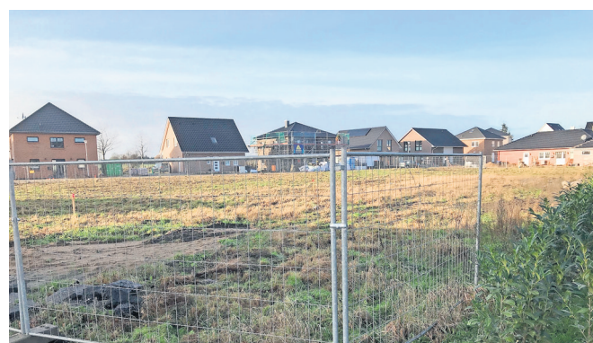
Das 3000 Quadratmeter große Baugrundstück am Bahndamm ist bereits eingezäunt. Ringsum stehen bereits Eigenheime.

Realisiert wird die Schaffung von insgesamt 1700 Quadratmeter Wohnfläche in zwei jeweils zweigeschossigen Geschossbauten plus Staffelgeschoss. Das Besondere an der Bauweise: „Nach außen hin in